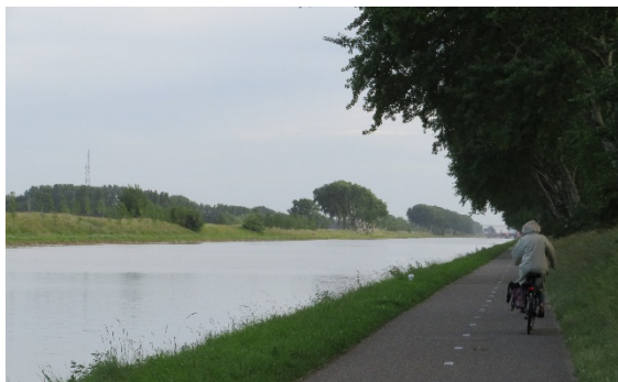
Restant deel Middelburg-Oost-Souburg

Het vervangen van de abelen aan de Vogeldijk (tussen Middelburg en Oost-Souburg) komt in de laatste fase. Door spreiding van de vervangingsfasen hebben we gelukkig nog vele jaren het karakteristieke beeld van het Kanaal kunnen behouden. Nu is de rek eruit. De methode Tuin van Zeeland , zoals de provincie deze aanpak is gaan noemen, heeft gewerkt. Het werpt vruchten af.