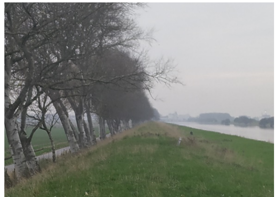
Deel naar Kleverskerke

In het deel naar Kleverskerke, waar ook veel bomen weg moesten, worden de gaten komende winter beplant. Helaas - i.v.m. de veiligheid - niet pal langs de weg, maar op de kruin en het talud aan de kanaalzijde. Ons verzoek aan de provincie om het aansluitende open deel ter hoogte van Kleverskerke nu al aan te planten is nog in behandeling. Ambtelijk staat men er positief tegenover. Het zou een mooie actie zijn in het kader van het 150-jarig bestaan van het Kanaal.